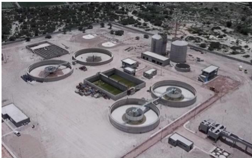
Imagen: PTAR Tenorio.

La Secretaría de Medio Ambiente y Recursos Naturales informa que el Comité Consultivo Nacional de Normalización de Medio Ambiente y Recursos Naturales (Comarnat) aprobó el pasado 27 de agosto, con la mayoría de votos de sus miembros, la Norma Oficial Mexicana NOM-001-SEMARNAT-2021, que establece los límites permisibles de contaminantes en las descargas de aguas residuales en cuerpos receptores propiedad de la Nación, por lo que será publicada en el Diario Oficial de la Federación en los próximos días.